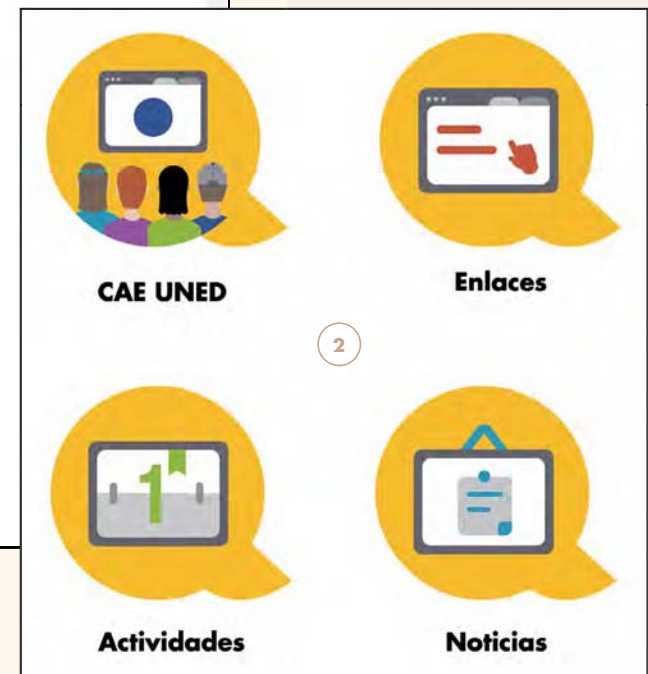
FIGURA 2. Breve muestra de la iconografía que se utilizará en el sitio web de la Comunidad Académica Estudiantil [CAE]